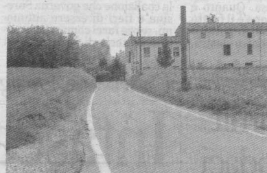
L'ingresso all'abitato di Ferie

L'opera, molto attesa dai residenti, costerà 822mila euro e verrà eseguita in convenzione fra Pizzighettone, San Bassano e Formigara, sotto la cui giurisdizione ricade Ferie, e la Provincia di Cremona. Il protocollo d'intesa tra i 4 enti risale a luglio 2007. A dare via libera al progetto il contributo regionale arrivato in primavera, pari a 300mila euro, che ha ridotto l'investimento locale a 522mila euro. Della ripartizione delle spese si è parlato in una recente conferenza dei sindaci: 200mila euro saranno in quota alla Provincia; la restante cifra sarà suddivisa tra due paesi in base al numero di residenti: 232mila euro a Pizzighettone, 90mila euro a San Bassano. Nessun investimento invece per Formigara che pur avendo giurisdizione su una parte del ter-