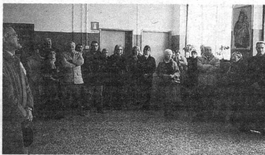
Familiari, amici e invitati alla cerimonia